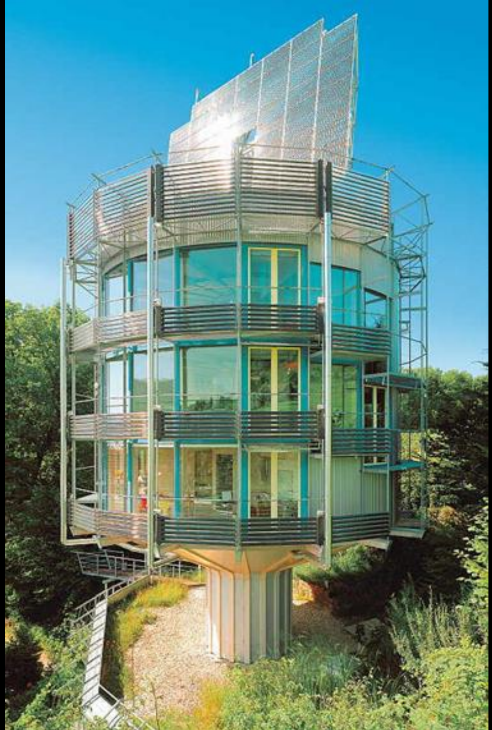
Das HELIOTROP IN FREIBURG