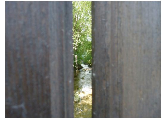
Begehung Projektübung los:ufern / TU Graz 2011

Das Führen eines Feldtagebuches ist mit dem Führen eines Tagebuches zu vergleichen - mit dem Unterschied, dass in dieses Feldtagebuch Dinge eingetragen werden, die auch alle lesen, betrachten dürfen. Alles was während der Erkundung auffällt, wird notiert, skizziert oder auch fotografiert. Das können Erlebnisse, wie das Beobachten eines Vogels oder auch ein auffallender Zaun sein.